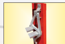
Ganchos de Aluminio Reforzado