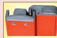
Remates de Plástico