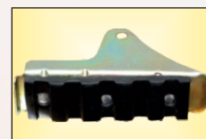
Pies de Seguridad Ajustables Antiderrapantes